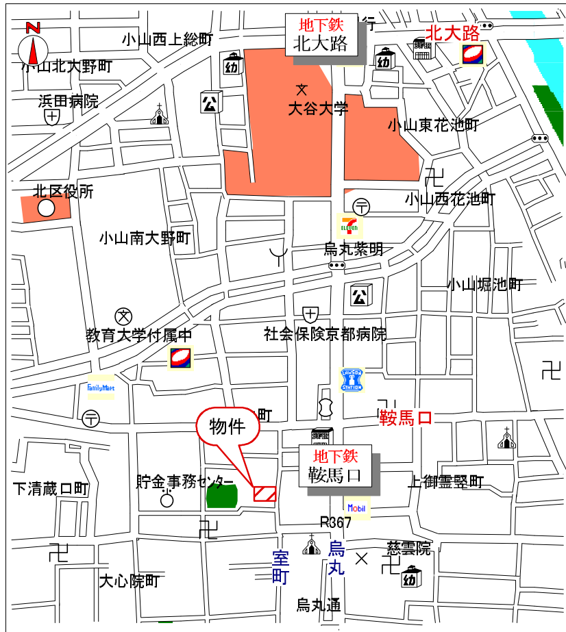
上京区室町通上御霊前上る竹園町2-1