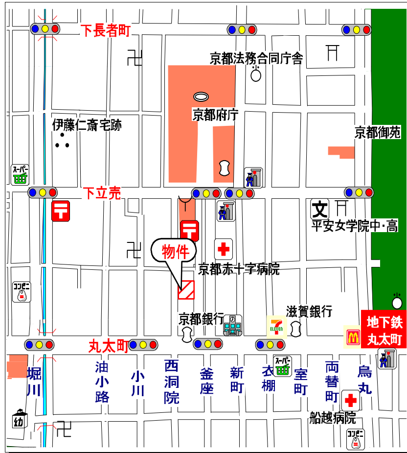
上京区釜座通丸太町上る夷川町380番地2